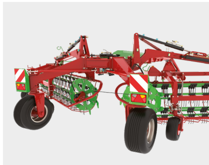
Self-steering system. Système auto directionnel.