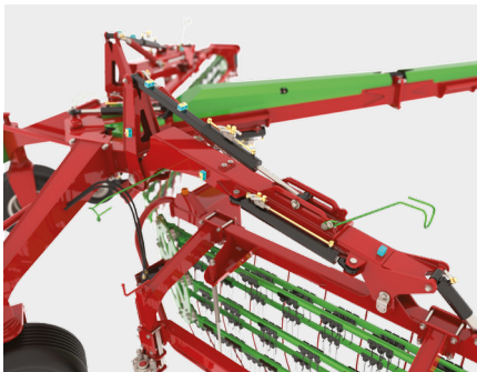
Hydraulic windrow width adjustment. Réglage hydraulique de la largeur d'andain.